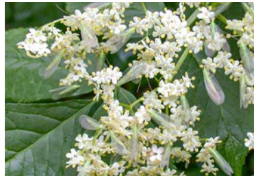
Ausgewachsene Florfliegen an einer Holunderblüte.