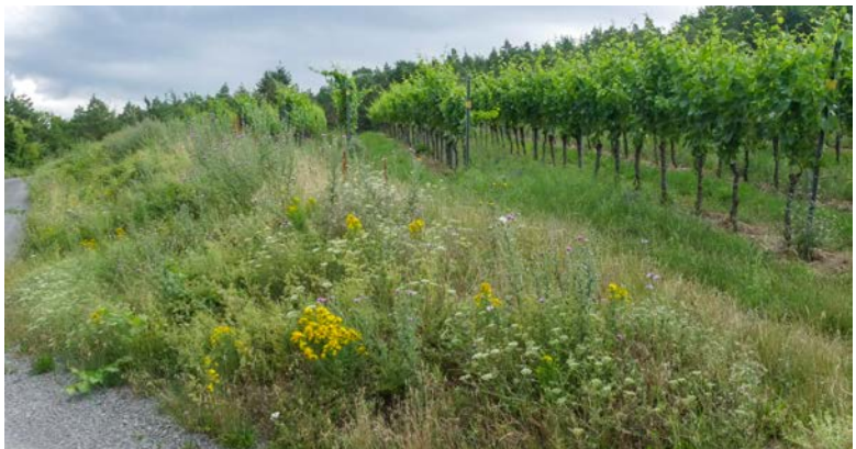
Vielfältige Begrünung im Umfeld.

www.lwg.bayern.de/cms06/weinbau/rebe_weinberg/310854