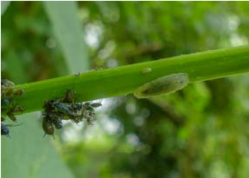
Räuberische Larve einer Schwebfliege und Läuse.