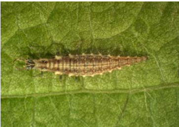
Räuberische Larve einer Florfliege.