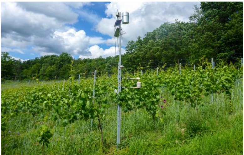
Wetterstationen liefern Daten für Prognosemodelle.

www.lwg.bayern.de/weinbau/rebe_weinberg/271492