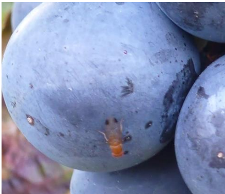
Abbildung 1: Männchen mit typischen schwarzen Flecken auf den Flügeln; Bild: LWG

In bereits weit durchgefärbten Anlagen anfälliger Sorten z.B. Rondo, Acolon, Regent, Frühburgunder sollte jetzt verstärkt auf das Auftreten von KEF und Schadsymptomen (Bild) geachtet werden.