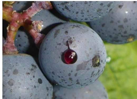
Abbildung 2: Saftaustritt bei Fraß der Larve

Weitere Informationen zu Fallen, vorbeugenden Maßnahmen und direkte Bekämpfungsmöglichkeiten finden Sie unter Link .