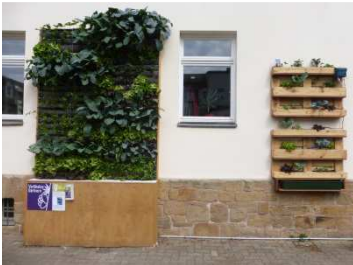
Bild 2: Profi-Fassadengarten und Paletten-System mit Gemüse am Forstamt Erlangen

Im Rahmen des Vorhabens in Erlangen entstanden auch verschiedene Flyer, Schautafeln und sogar kleine Filme.