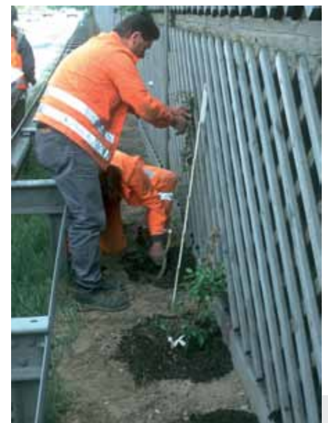
Bild 4: Der anstehende Oberboden wurde im Wurzelbereich entfernt und mit verschie- denen Testsubstraten ersetzt.