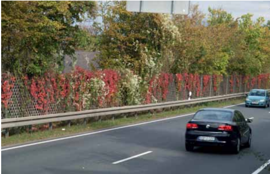
Bild 5: Die Herbstfärbung der Parthenocissus -Arten verleiht den Wänden eine hohe Attraktivität.