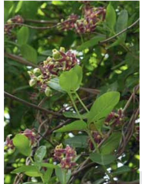
Bild 7: Die orientalische Baumschlinge Periploca graeca war eine der besten Arten im Test.