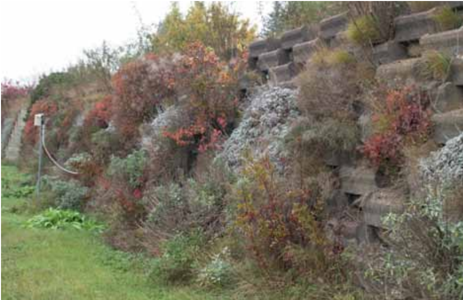
Bild 3: Besonders attraktiv zeigen sich die Wälle im Herbst durch das Rot von Cotinus coggygria und Rosa virginiana .

hölzen war dies lediglich in den ersten drei Jahren der Fall. Im Test befanden sich zwei Oberbodenvarianten der Boden- gruppe 4+5, eine davon enthielt einen Anteil von 30% Lava 2/12. Daneben wurden Zincolith R und Vulkaterra E geprüft. Die Unterschiede zwischen den Substraten auf die Pflanzenentwicklung waren gering, die Oberboden/Lava-Mischung wies langfristig aber geringe Vorteile auf. Die Erdkerne zeigten keinen Einfluss auf die Pflanzenentwicklung.