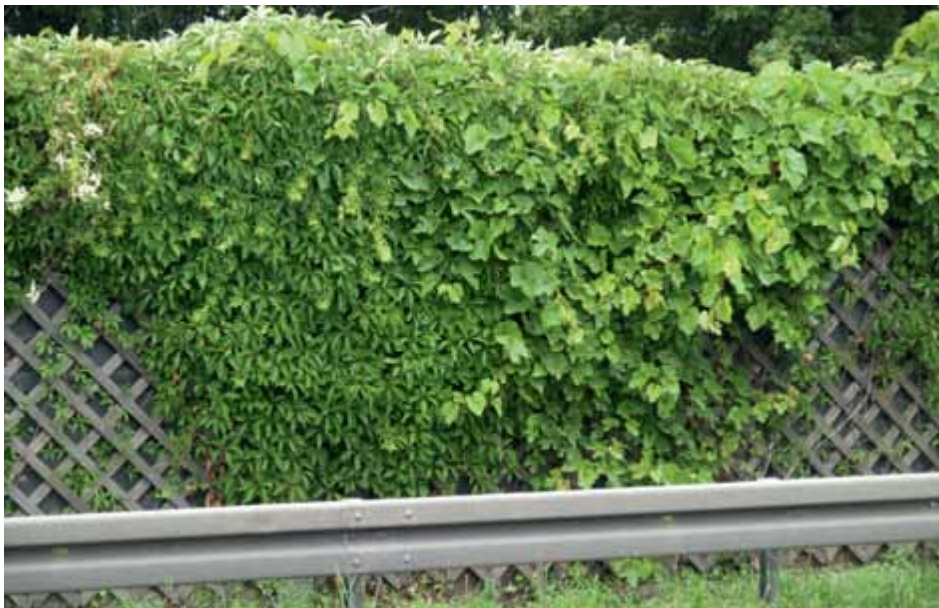
Bild 6: Parthenocissus quinquefolia 'Engelmannii' und Vitis amurensis zeigten sich besonders dauerhaft.

handen. Von dreizehn auf der S-W-Seite besonders guten Arten fielen im weiteren Versuchsverlauf Lonicera x heckrottii 'Goldflame' sowie Euonymus fortunei var. radicans aus.