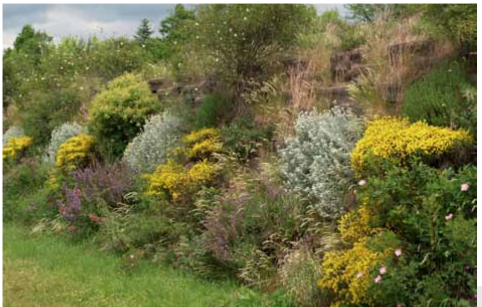
Bild 2: Im System Verduro leuchten zusätzlich die Blüten von Genista lydia in Gelb.

Alyssum saxatile 'Citrinum' zog sich zum Versuchsende komplett auf die Nordseite zurück. Bei allen anderen Arten spielte die Ausrichtung der Wälle keine Rolle.