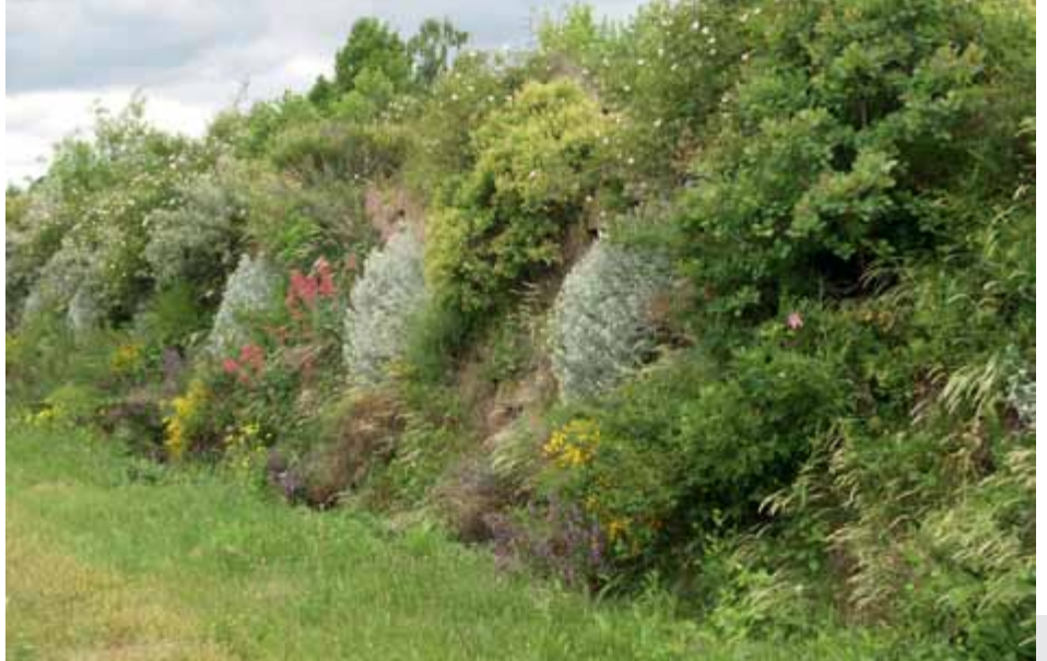
Bild 1: Als Aspektbildner im Frühsummer bewährten sich Cotinus coggygria , Rosa agrestis , Chrysanthemum haradjanii sowie Salvia officinalis und Centranthus ruber im System Alpenstein.