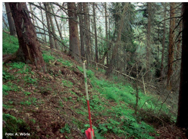
Abbildung 3: Die Graswanger Fläche GR-1 im Jahr 2010

Auf den Flächen GR-1, GR-2 und GR-3 bei Graswang schwankte die Pflanzenzahl pro Hektar im Jahr 2010 zwischen 7.000 und 12.500. Der größte Teil der Verjüngungspflanzen