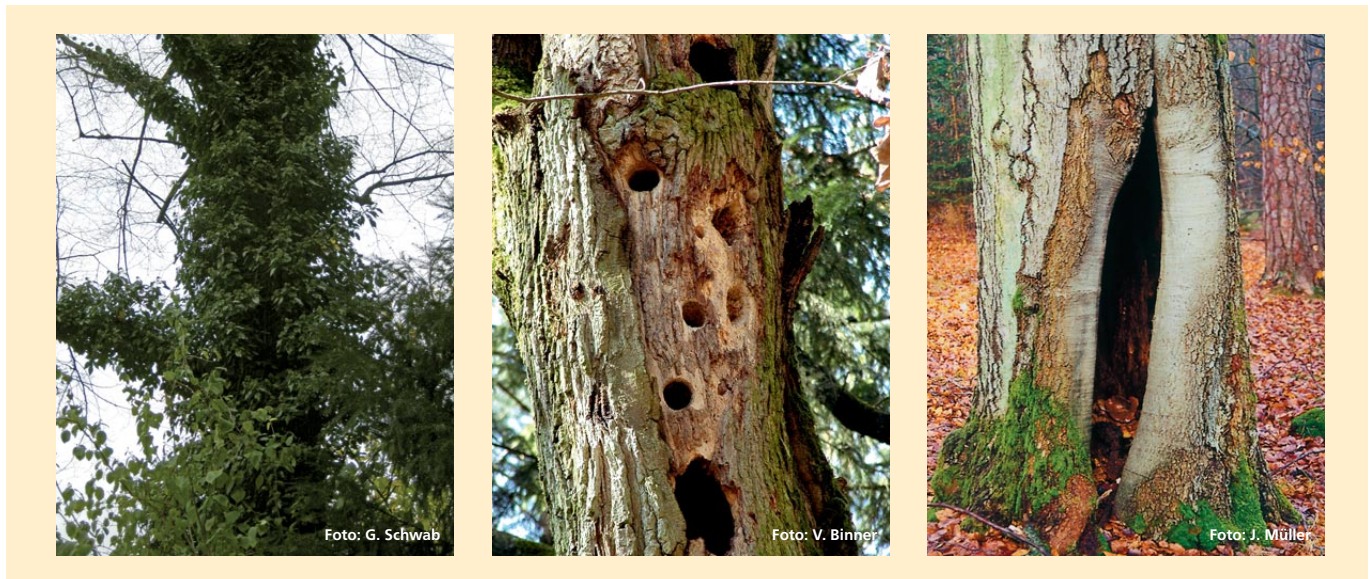
Abbildung 6: Biotopbäume haben viele Gesichter, sie haben aber auch eines gemeinsam: Für zahlreiche spezialisierte Tier-, aber auch Moos- und Flechtenarten sind sie ein wichtiger Bestandteil ihres Lebensraumes. Biotopbäume erhalten und fördern sind wichtige, aber auch einfache Maßnahmen für den Artenschutz in Wäldern.

Schutzkonzepte. Sie reagieren auf Strukturen! Die Strukturvielfalt im Urwald entsteht durch dynamische Zufallsprozesse (z. B. Sturm, Brand), im Wirtschaftswald aber durch forstliche Nutzung (z. B. Pflegeeingriffe, Durchforstung, Verjüngung). Ein naturnaher Waldbau nutzt natürliche Prozesse ganz selbstverständlich. Das Beobachten und Erkennen der natürlichen Waldentwicklung, mit Werden und Vergehen, das Wissen um Wuchsdynamik und Konkurrenzverhalten der Baumarten lässt aus ökonomischer und ökologischer Sicht steuernde Eingriffe ohne großen Aufwand zu. Eine integrative Waldbewirtschaftung kann mit geeigneten forstlichen Maßnahmen kleinflächige Störungsmuster (z. B. Lichtschächte) und deren positive ökologische Wirkungen nachahmen oder kleinflächige natürliche Störungen als ökologische Bereicherung integrieren, ohne dabei andere Waldfunktionen oder ökonomische Zielsetzungen zu gefährden.