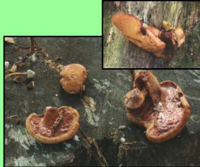
Leberpilz, Ochsenzunge Fistulina hepatica