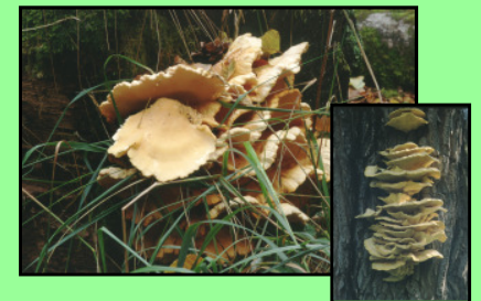
Schwefelporling Laetiporus sulphureus