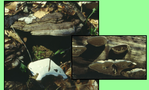
Flacher Lackporling Ganoderma lipsiense