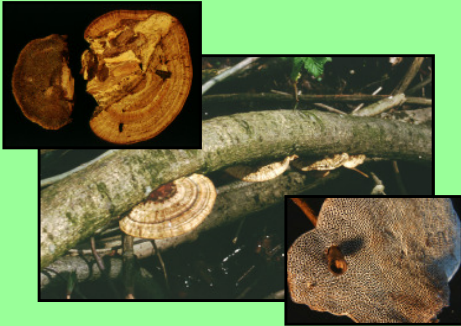
Rötende Tramete Daedaleopsis confragosa