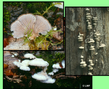
Gemeiner Spaltblättling Schizophyllum commune