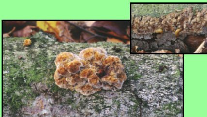
Buchen-Schillerporling Inonotus nodulosus