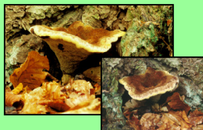
Kiefernbraunporling Phaeolus schweinitzii