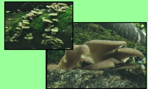
Austernseitling Pleurotus ostreatus