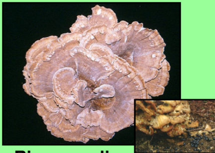
Riesenporling Merpilus giganteus