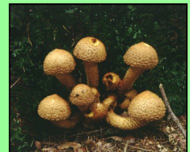
Sparriger Schüppling Pholiota squarrosa