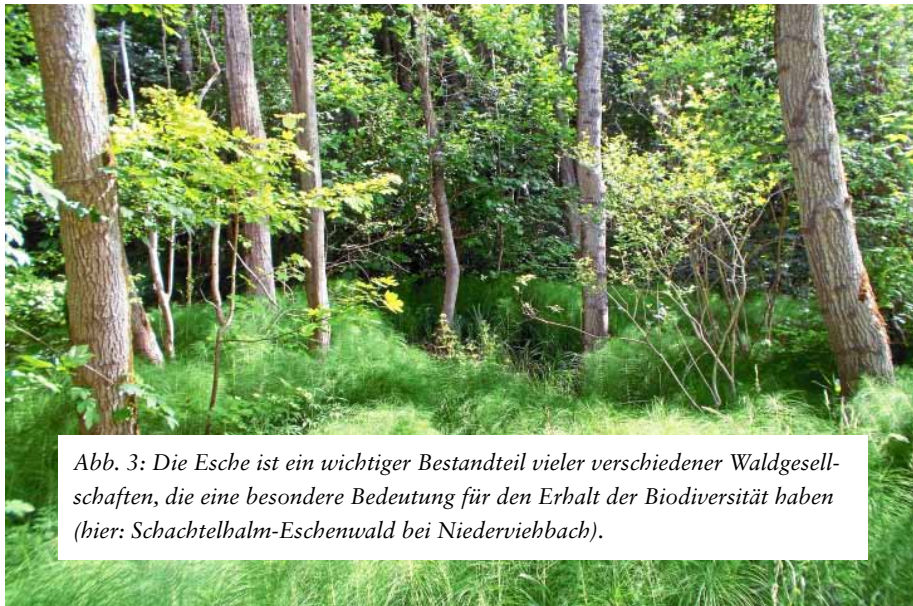
Abb. 3: Die Esche ist ein wichtiger Bestandteil vieler verschiedener Waldgesellschaften, die eine besondere Bedeutung für den Erhalt der Biodiversität haben (hier: Schachtelhalm-Eschenwald bei Niederviehbach).