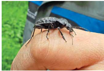
Abb. 5: Der Erhalt vieler Arten wie der FFH-Art Grubenlaufkäfer ( Carabus variolosus ) hängt nicht direkt an der Esche, aber am pfleglichen Umgang mit unseren Eschen-Mischwäldern.