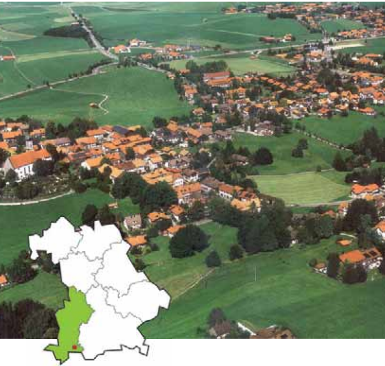
Gemeindezentrum stellt Weichen

Soll das neue Gemeindezentrum mit Rathaus, Saal, Tourismusbüro und Bibliothek im Dorf oder auf der grünen Wiese errichtet werden? Diese Frage wurde lang und kontrovers diskutiert. Nun ist das Gemeindezentrum im Dorf errichtet und bringt Leben in seine Mitte. Zudem eröffneten die Diskussionen um den Standort auch ein Selbstverständnis, der Innenentwicklung den Vorzug vor dem Flächenverbrauch am Ortsrand zu geben. Zwei Mehrfamilienhäuser im Innenbereich, einfache Bebauungspläne für den Ortskern und eine entsprechende Baulandpolitik sind Zeichen dieser Planungsverantwortung. Parallel zu diesen Entwicklungen wurde bereits die Staatsstraße vorausschauend für das Verkehrsaufkommen nach der Fertigstellung der A 7 ausgelegt und ihre Randbereiche sowie der Kirchplatz im Rahmen der Dorferneuerung für ein attraktives Seeg gestaltet.