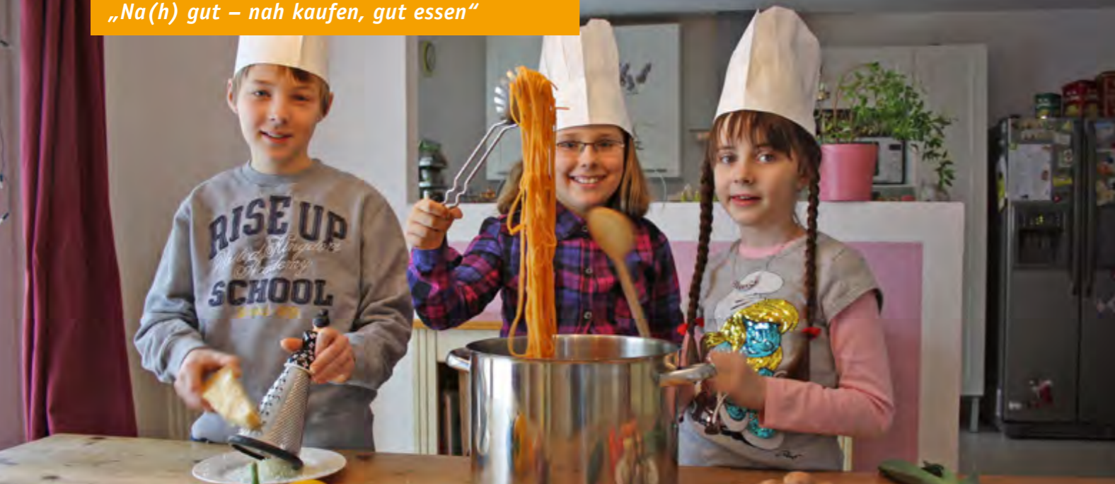
Kochen lernen macht Spaß – nicht nur wegen der schicken Kochmützen.