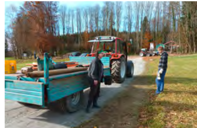
Landwirte stellten ihre Traktoren und Gerätschaften zur Verfügung.

Die Filze in der Talmulde des Steinbachs zwischen Törwang und Grainbach ist ein beliebtes Naherholungsgebiet in einer grünen Kulturlandschaft mit Feucht- und Nasswiesen und Niedermooren. Mit dem Projekt „Erlebnis Samerberger Filze“ wurde nun dieser besondere Naturraum zu einem naturnahen Erholungsgebiet weiterentwickelt, wobei aber nicht nur dem Naturschutz, sondern auch der Landwirtschaft Rechnung getragen wurde. Der größte Brocken war die Neukonzeption des alten Filzenbades, das in den 60er Jahren in die Landschaft betoniert worden war. Bagger rückten an und brachen einen Teil der Betonumfassung ab. Mit Hilfe einer Folie