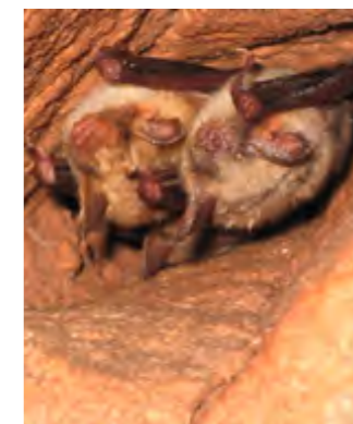
Mausohren im Winterquartier.