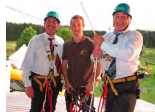
Spontane Aktion bei der Einweihung: Minister Helmut Brunner und Landrat Georg Huber gehen mit gutem Beispiel voran.

Gastronomie. Flying Fox und Aussichtsturm machen den Besuch noch reizvoller. Bei der Einweihungsfeier für den Flying Fox und den Turm, zu der auch Landwirtschaftsminister Helmut Brunner angereist war, betonte Landrat Georg Huber die überregionale Bedeutung dieser Einrichtung, die zugleich auch eine wichtige weitere Einkommensquelle für die Landwirte sei. Minister Brunner wiederum staunte über die stürmische Entwicklung, die das Projekt seit seinen Anfängen vor zehn Jahren genommen hat. Die Fläche wuchs von 10 auf 15 Hektar, die Besucherzahl habe sich auf 120 000 verdreifacht, darunter 40 Prozent Kinder, und auch die Anzahl der Beschäftigten sei kräftig angewachsen. Er nannte die neue Anlage in Anspielung auf den hohen Turm