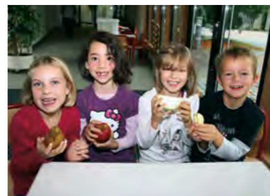
Kinder lernen Obst und Gemüse kennen und schmecken.

Ein weiterer Baustein des Projekts sind Betriebsbesuche. Die Kinder sollen die Direktvermarkter und deren Produkte in ihrer Umgebung ebenso kennen lernen wie die Herstellung auf dem Bauernhof und die kurzen Transportwege bis zum Verbraucher. Thematisiert wird dabei auch der