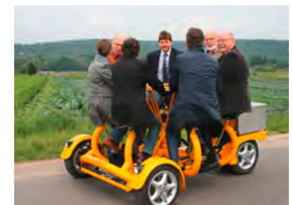
Gruppenerlebnis: Mit einem Mehrpersonenfahrrad können die einzelnen Stationen des Lehrpfades angefahren werden.

genheiten und Orientierungshilfen. Dazu kommen Lehrpfade und ein historischer Lehrgarten mit alten Gemüse- und Kräutersorten – und nicht zuletzt zwei vierrädrige Mehrpersonenfahrräder, mit dem kleine Gruppen die einzelnen Stationen besuchen können.