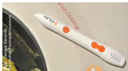
Der Hörstift eröffnet neue Möglichkeiten im Bereich des musealen Audioguides.

Möglich gemacht hat dies unter anderem auch eine großzügige Zuwendung aus dem Leader-Projekt, mit der ein Teil der neuen Inneneinrichtung finanziert wurde. Notwendig wurden die Aus- und Umbaumaßnahmen, weil in den bisherigen Räumen der Brandschutz nicht mehr gewährleistet war. So nutzte man die Chance, die Ausstellungs- und Veranstaltungsflächen mit einem Neubau zu ergänzen und nach modernster Museumsdidaktik zu gestalten.