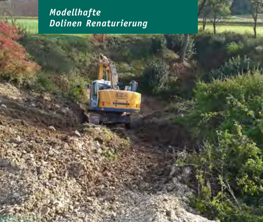
Im steilen Gelände der Doline Otterzhofen bei Riedenburg muss der Bagger Schwerstarbeit leisten.