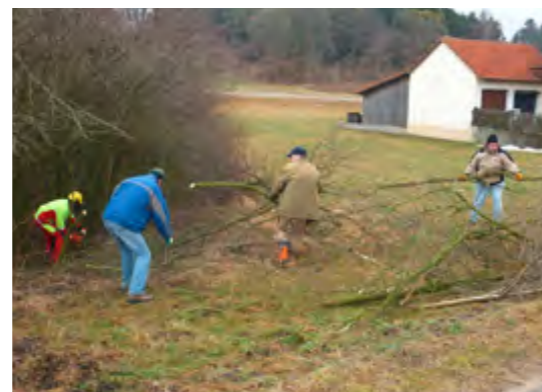
Ohne aktive Bürgerbeteiligung nicht machbar!

Dolinen sind Spalten, kraterartige Bodeneinbrüche, die durch Erosion im Kalkgestein entstehen, wenn Regen und Schmelzwasser die Mineralien im Gestein lösen und ausspülen. Häufig anzutreffen sind sie im Karst des Jura, insbesondere rund um Riedenburg, Beilngries, Breitenbrunn und Dietfurt. Weil diese geologischen Besonderheiten gleichsam eine direkte Verbindung zwischen der Bodenoberfläche und dem Grundwasserstrom darstellen, gelten sie als neuralgische Stellen für den Schutz des Trinkwassers, denn mit dem ungefilterten Abfluss von der Oberfläche werden oft Dünger oder Pflanzenschutzmittel aus der