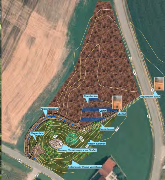
Ein genauer Plan für alle notwendigen Maßnahmen stand am Beginn der Arbeiten.