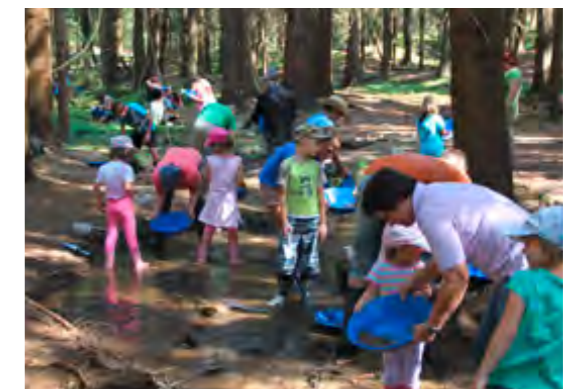
Spannend: Manchmal bleiben in den Pfannen kleine glänzende Brösel zurück!

Leistungen des Amtes für Ernährung, Landwirtschaft und Forsten Neumarkt i.d.Opf Beratung bei der Projektentwicklung und Konzeption, Förderabwicklung