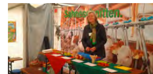
Zum Schmecken lernen gehört auch Theorie.

Beratung bei der Projektentwicklung und Konzeption, Förderabwicklung