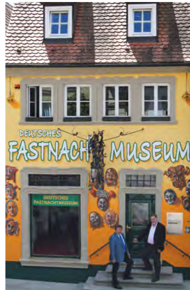
Das Deutsche Fastnachtmuseum – ein Ort mit Augenzwinkern.