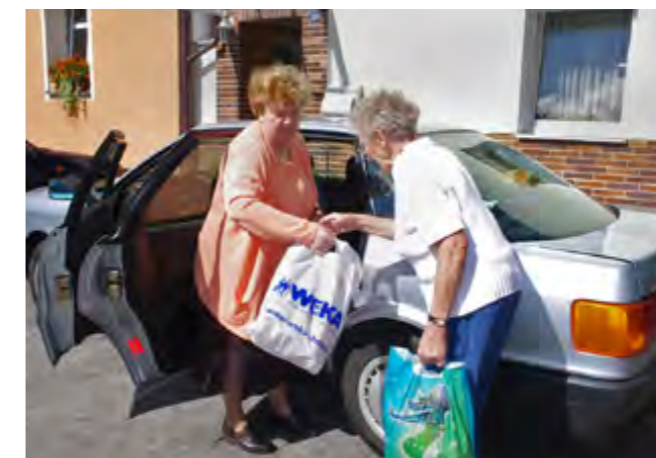
Große Entlastung: Der Einkauf wird direkt an die Tür gebracht.

Mit den Zuschüssen der Europäischen Union über das Leader-Programm wird vor allem ein Netzwerkmanagement für die Seniorengemeinschaft eingerichtet mit einer Spezialsoftware zum Aufbau eines Tauschrings, der die Generationen übergreift und verbindet. Dazu gehört auch eine Vollzeitkraft für die Dauer von zunächst drei Jahren.