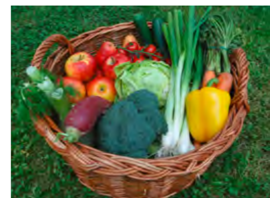
In der Kochschule wird Leckeres aus der Region verarbeitet.

Tier- und Umweltschutz. Wie Fleisch und Gemüse, Salat und Obst, Milch und Eier anschließend in ein wohlschmeckendes Gericht verwandelt werden können, das zeigen die Gastwirte aus dem Wittelsbacher Land ihren kleinen Gästen dann in der „Kinderkochschule“. Der Höhepunkt ist das anschließende gemeinsame Essen, bei dem all die leckeren Gerichte auch verspeist werden. So erleben die Kinder auf spielerische Weise, dass gesundes Essen viel besser schmeckt als Fastfood aus der Tüte und dass auch die Zubereitung schon viel Spaß machen kann.