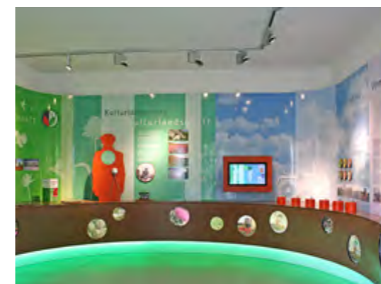
Der Aktionspavillon in Schwebheim lädt zum Entdecken und Erleben der einmaligen Kräuterlandschaft mit allen Sinnen ein.

Fünf gemeinschaftliche Ziele haben sich dabei herauskristallisiert: die Stärkung des örtlichen Selbstbildes, die Profilierung der Wahrnehmung von außen, die Hebung des Freizeitwertes der landwirtschaftlich genutzten Fluren, die Unterstützung der lokalen Betriebe und schließlich auch die Förderung der Biodiversität sowie des Artenschutzes. Zentrale Anlaufstelle in jeder Gemeinde ist dafür ein Info-Pavillon mit Sitzgele-