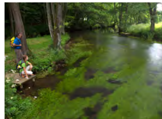
So malerisch kann Erholung sein: Schöne Ausblicke verzauern die Blicke der Wanderer.

Das Gewässer entspringt nahe der europäischen Hauptwasserscheide im Ort Laaber in der Nähe von Neumarkt i. d. Opf, wo sich die Fluss-Systeme von Atlantik und Mittelmeer trennen. Es sprudelt aus einer Karstquelle des Oberpfälzer Jura und schlängelt sich in unzähligen Windungen über etwa 75 Kilometer bis zur Donau hin, wo sie bei Sinzing mündet. Der Name kommt wohl daher, weil sie träge dahin fließt und das Wasser deshalb dunkel erscheint. An diesem Fluss mit den vielen alten Städtchen und Dörfern an seinen Ufern sollen sich nun vor allem Ausflügler und Urlauber tummeln. Die Fahrradtour im Tal der Schwarzen beginnt oder endet am Bahnhof in Neumarkt, gut 10 Kilometer von der Quelle entfernt. Daher ist die Länge der Tour rund 85 km.