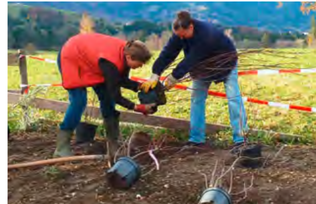
Alle sind stolz auf das große Engagement aus den eigenen Reihen: Bei der Pflanzaktion war viel Tatkraft gefragt.

entstand ein Schwimmteich, dessen hervorragende Wasserqualität mit Hilfe einer Natur-Kies-Filteranlage samt nachgeschalteter Pflanzenkläranlage gesichert werden konnte. Verschmutztes Wasser wird durch dieses praktisch vollbiologische System gepumpt und kommt völlig sauber wieder zurück.