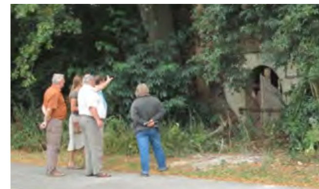
Oft bleiben Felsenkeller aus Sicherheitsgründen ungenutzt.

Viele dieser übermannshohen Felsenkeller wurden mühselig über Jahre aus dem weichen Sandstein geschlagen und bilden ein verzweigtes Labyrinth von Gängen. Noch komplexer sind oft die Eigentumsverhältnisse und Nutzungsrechte, die über Generationen vererbt wurden und nur selten schriftlich niedergelegt sind. Nur noch wenige Experten und alteingesessene „Kellerrechtler“ kennen sich damit aus. Kein Wunder, denn zum Beispiel am Voggen-dorfer Kellerberg gruppieren sich fast 30 verschiedene Kellereingänge um einen der gern besuchten