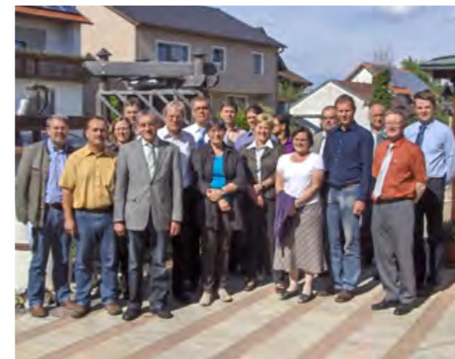
Alle Fachbehörden in einem Boot: Beim gemeinsamen Termin wurden die Zuständigkeiten geklärt und das weitere Vorgehen festgelegt.

Landwirtschaft eingeschwemmt. Ein weiteres Problem besteht darin, dass sich im Laufe der Zeit auch Lehm und Sand in den Dolinen so stark ansammeln, dass sie „dichtmachen“, kleine Gewässer bilden und z. B. bei der Schneeschmelze Überschwemmungen auslösen können.