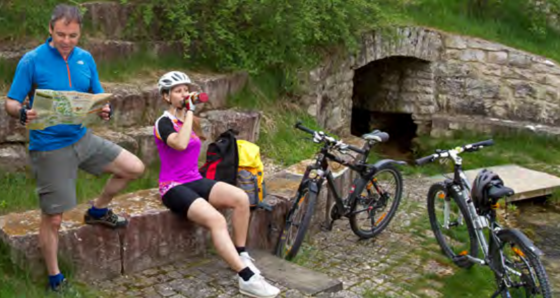
Radwandern liegt im Trend. Die neue Rad-Wander-Karte zeigt den Weg zu lohnenden Zielen entlang der Schwarzen Laber, hier die Quelle.