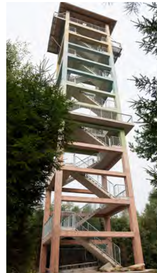
Ebenso luftig und mit guter Fernsicht: Vom 30 Meter hohen Aussichtsturm geht der Blick bis zu den Alpen.

Der Wildpark war immer schon Anziehungspunkt: Er beherbergt eine Vielzahl verschiedenster Tiere vom Hängebauchschwein bis zu Greifvögeln, einen Waldseilgarten, diverse Kinderspielgeräte, sogar eine Sternwarte und natürlich auch eine