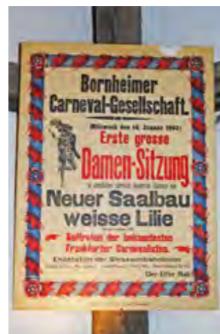
Das Museum beherbergt historische Plakate und eine der wohl weltweit größten Sammlungen von Orden und Plaketten.

Themen und Ausstellungsmaterial gibt es dafür reichlich. Karneval, Fasching, Fastnacht – das sind schließlich seit mehr als 700 Jahren feste Bestandteile der abendländischen Kultur. Dazu gehören Till Eulenspiegel ebenso wie der venezianische und der römische Karneval mitsamt ihren Einflüssen auf den rheinischen Karneval und den Münchner Fasching. In Franken ist das Highlight natürlich die jährliche Prunksitzung zu Veitshöchheim, womit auch der Bogen zur Entwicklung des politischen Karnevals gespannt ist. Dessen historische und aktuelle Hauptakteure werden im neuen Museum ebenfalls gezeigt – einschließlich mancher Ausschnitte aus den Reden.