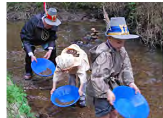
Echte Suche nach echtem Gold in echten Kostümen!

Unterstützt mit einem kräftigen Zuschuss aus dem Leader-Programm ist ein Gold-Lehrpfad angelegt worden, der auf drei verschiedenen Routen zum Wandern einlädt. Die Wege sind maximal 4 Kilometer lang und führen entlang der heute noch reichlich vorhandenen historischen Spuren des mittelalterlichen Goldabbaus. Ausgangspunkt für die Wanderungen ist die Info-Stelle bei „Gütting“, südöstlich von Unterlangau, 8,5 Kilometer von Oberviechtach entfernt, wo die Geschichte des Goldabbaus mit Schautafeln anschaulich dargestellt wird.