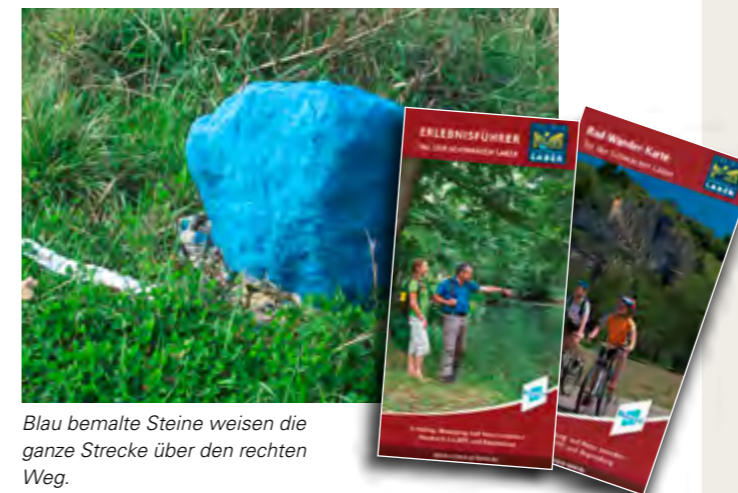
Blau bemalte Steine weisen die ganze Strecke über den rechten Weg.