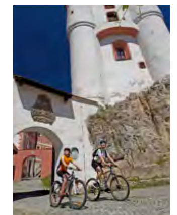
Natureerlebnis pur auf Schusters Rappen oder dem Drahtesel.