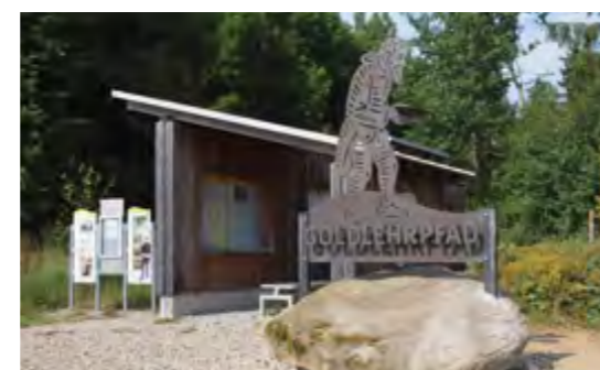
Info-Tafeln am Ausgangspunkt des Goldlehrpfades erläutern die Geschichte des Goldabbaus.

Wenn sich auch die Ausbeute im großen Stil nicht lohnt, so führen die Bäche rund um Unterlangau heutzutage doch immerhin noch so viel Gold, dass die Idee entstand, mit einem touristischen Angebot daran anzuknüpfen.