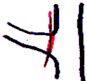
Schnitt auf Astring

Auf größeren Wunden darf kein Wasser stehen bleiben, es muss ablaufen können. "Stummelschnitte" sind zu vermeiden. Sie stellen für Krankheitserreger geeignete Eintrittspforten dar. Diese Aststücke sterben ab und können nicht durch das Wundgewebe überwältigt werden. Günstiger ist ein Schnitt auf Astring, d. h. der Schnitt wird direkt an der Ansatzstelle durchgeführt. Wunden, die mehr als 3 cm Durchmesser haben, können mit einem Wundverschlussmittel behandelt werden. Wichtig ist, die Wunde vor dem Verstellen der Leiter zu verstreichen.