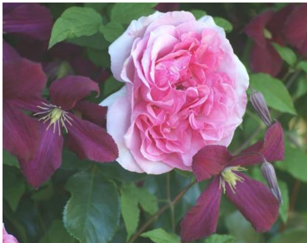
Eine zauberhafte 'Rosenpoesie' zusammen mit Clematis viticella 'Madame Julia Correvon'

Als Einzelpflanze im Garten eingesetzt, können diese Clematis genauso gut nach dem Winter im zeitigen Frühjahr zurückgeschnitten werden.