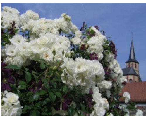
'Schneewittchen' und 'Etoile Violette' in einem fränkischen Garten

Rosafarbene Rosen wie z.B. 'Rosanna', 'Rosarium Uetersen' und 'Fassadenzauber' passen sehr gut zu blauviolettten Clematis. Neben der äußerst robusten C. viticella 'Etoile Violette' sind noch C. viticella 'Romantika' und 'Polish Spirit' zu nennen, welche ähnlich tolle Farbkontraste hervorrufen können und z.B. 'Jackmannii', was die Schönheit der Blüten angeht, eindeutig übertreffen. Ganz hervorragend wären aber auch die blauen Glöckchen von C. viticella , der reinen botanischen Art, geeignet. Sie umspielen nahezu jede Rose in einer ganz eleganten und leichten Art und sind der robuste Tipp für alle Fälle.