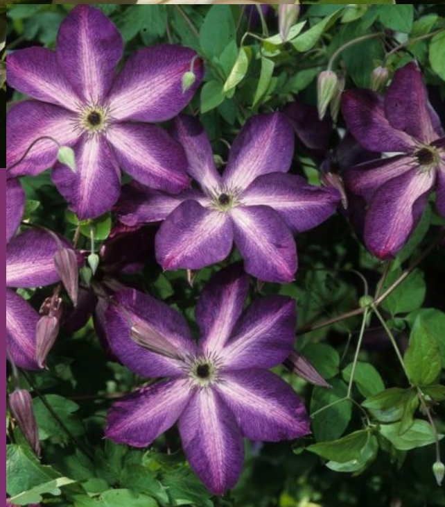
Clematis viticella 'Venosa Violaceae'