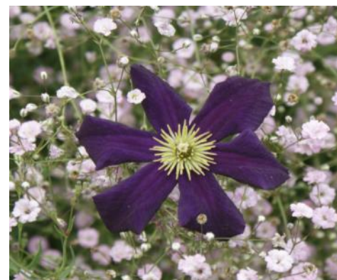
Clematis viticella 'Romantika'