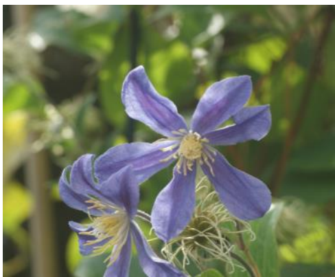
Clematis integrifolia 'Juuli'

Bei den sommerblühenden Hybriden wie z.B. 'Jackmannii', 'Hagley Hybrid', 'Ville de Lyon', 'Perle d'Azur', 'Comtesse de Bouchaud' ist Welke möglich, aber viel seltener. Wenn dann sterben meist nur ein paar wenige Stränge ab, nur manchmal die ganze Pflanze. Warum? In diese Gruppe ist häufig das Blut der italienischen Waldrebe, Clematis viticella , eingekreuzt und darin liegt auch die Lösung: Viele botanischen Arten werden fast niemals welk und je größer z.B. der Anteil an C. viticella an den Hybridsorten ist, desto geringer ist die Wahrscheinlichkeit der Welke.