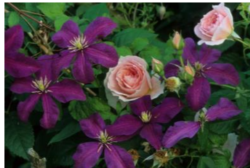
Clematis viticella 'Polish Spirit' und die einmalblühende ADR-Rose 'Kir Royal'

Bei den gelben Kletterrosen empfiehlt sich die Farbpalette von blauviolett bis hin zu rotviolett. Ein toller Effekt entsteht beim Kombinieren von 'Golden Gate' mit der nostalgisch anmutenden, gefüllten Blüte von C. viticella 'Purpurea Plena Elegans'. Dies ist allerdings eine relativ stark wachsende Sorte, so dass der Abstand stimmen muss und nur einzelne Stränge herübergezogen werden sollten.