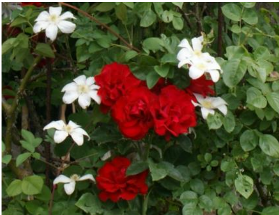
Die Farbe Rot wird am besten mit einer weißen Clematis - hier die Sorte 'Huldine' - kombiniert.

Aber auch Kombinationen mit unterschiedlichen Blühzeiten sind denkbar. Durch die entsprechende Sortenwahl kann die Clematisblüte vor der Rosenblüte, wie in den oben genannten Beispielen zeitgleich oder leicht versetzt mit der Rosenblüte erscheinen. Sie kann die Blütezeit der Klettergemeinschaft sogar nach hinten hin verlängern. Die Rose dient dann lediglich als Kletterhilfe.