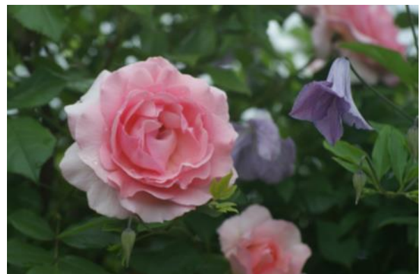
'Sorbet' und Clematis viticella 'Betty Corning'

Diese Kombinationen können, müssen aber nicht unbedingt geschnitten werden; die Clematis wachsen quasi „mit“. Die gelben Clematis bitte nur für ganz kräftig wachsende Rosen verwenden!